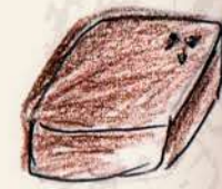
アルパコ 66% エクアドル産 チョコレートの ガナッシュ