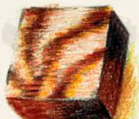
イランカ ペルー産カカオ豆の シングルオリジン