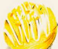
★ トリュフコネル レモンガナッシュと ウォッカのトリュフ