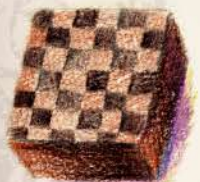
ラヴァンド ブラックベリーの パートドフリュイと ラベンダーのガナッシュ