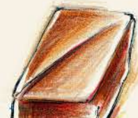
プラリネアモンド アーモンドプラリネと サクサクフィヤンティーヌ