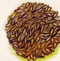
★ トリュフココ ココナッツ風味の トリュフ