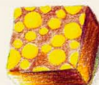
マングヴィオレット マンゴガナッシュに スマイルの香りをつけて…