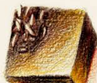
★ ココマンジャリ マンジャリ64%の ガナッシュ ココナッツ風味