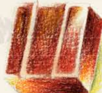
プロヴァンス はちみつやナッツ 柑橘類のヌガーを ビターチョコレート でコーティング