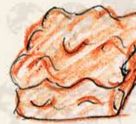
★ タタン ミルクチョコレートと リンゴのガナッシュ