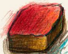
マンジャリパートドフリュイ マンジャリガナッシュと グリオットの パートドフリュイ