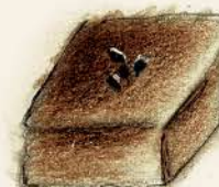
セザム ゴマとアーモンドの プラリネ