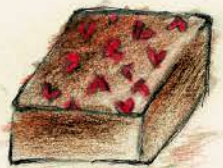
クレーパダンテル サクサクフレークを ミルクチョコで コーティング!