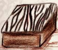
★ フォレノヴァール ビター&ホワイト ガナッシュの間に グリオットチェリーの パートドフリュイ