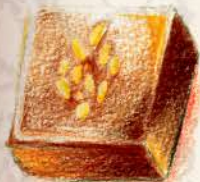
トンカ 桜の香りのする トンカ豆のガナッシュ