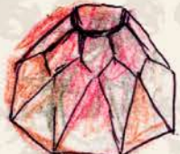
キャラメルオレンジ オレンジ風味の キャラメル入り