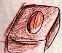
カプチーノ ミルクチョコレートと コーヒーのガナッシュ