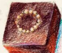
パンデピス 香り高きスパイス ミックス