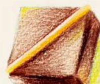
ジャスマン 上品なジャスミンの 花の香り