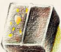
クロッカアンアモンド キャラメルとプラリネの ショコラ アーモンド入り