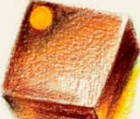
イパワー・パッション パッションフルーツ風味の ガナッシュ