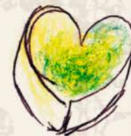
キャラメルシトロンベール ライム風味の爽やかな キャラメル味