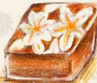
アールグレイ アールグレイと ジヴァララクテの ガナッシュ