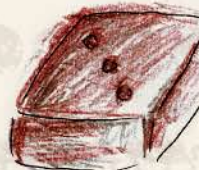
マカエ 62% ブラジル産カカオの ガナッシュ 芳醇でフルーティーな 香り