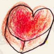
★ フランボワーズ ラズベリー風味の ガナッシュと パートドフリュイの2層