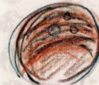
ペタセタ ヘーゼルナッツの プラリネとパチパチ キャンディ入り