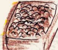
タイノリ 64% ドミニカ産カカオの フルーティーな ガナッシュ