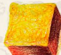
シヴァラ・ユズ ミルクチョコレートに ゆずのガナッシュ